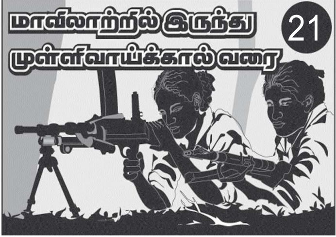
முள்ளிவாய்க்காலில் கிறுத் வரை நீன்று போராடிய போராளியின் அனுபவப் பத்ய கிது. பாதுகாப்பான களம் ஒன்றை கிவர் சென்றடையும் வரை கிவரது விபரங்களை கவிர்க்குகொள்கின்றோம்.

களமுனைவில் எதிரியுடன் நேரடியாக சண்டையிட்டு உடலெங்கும் பல விழுப்புண்களை தாங்கிக்கொண்டும்