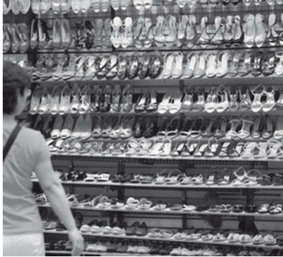
பாதணிகள் உரிமையாளர்களால் மீள்பெறப்பட்டுள்ளன. 59 வயது பார்வையின் அடுத்த திட்டம் என்னவாகும். என்பதே சேயுள் நகர வாசிகளின் கேள்வி?

உபயோகித்த 1200 சோடி விலையுடைய பாதணிகளை திருடிய தென்கொரியர் ஒருவரை காவல்துறையினர் கைது செய்துள்ளனர். மரண வீடுகளிற்கு அனுதாபம் தெரிவிப்பவர் போலீசு செல்லும் பார்வையை தடுத்து பழைய பாதணிகளை அங்கேயே கழற்றிவிட்டு விலையுயர்ந்த பாதணிகளை அணிந்துகொண்டு வந்து விடுவார். மரணவீட்டிற்குச் செல்லும் தென்கொரியர்கள் மரியாதையின் நிமித்தம் உடல் வைத்திருக்கும் இடத்திற்கு சற்று வெளியே தமது பாதணிகளைக் கழற்றிவிட்டுச் செல்லும் பழக்கமுடையவர்கள் என்பதோடு, வீட்டிற்கு வெளியே உபயோகிக்கும் பாதணிகளை வீட்டிற்குள் அணிந்து வரமாட்டார்கள். இவ்வாறு திருடிய பாதணிகளை தனது பழைய பொருட்கள் விற்கும் கடையில் விற்கும் வந்தார். வழமைபோலவே இவர் தனது கைவரிசையைக் காட்ட முற்பட்டபோது கையும் களவுமாக பிடிக்கப்பட்டு காவல்துறையினரிடம் ஒப்படைக்கப்பட்டார். இவ்வாறு சேமிப்பு இடங்களை தீவிர சோதனையிட்டபோது 1200 சோடி பாதணிகள் அளவின் அடிப்படையில் நேர்த்தியாக அடுக்கப்பட்டு விற்பனைக்குத் தயாரான நிலையில் இருந்ததைக் கண்டு ஆச்சரியமடைந்தனர். இப்பாதணிகளை மக்களின் பார்வைக்காக அழகு காவு நலையத்தில் வைத்தபோது பெரும்பாலான